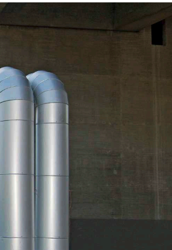
Über diese Leitung unter der Rhein-Brücke kommt die Fernwärme jetzt bis nach Speyer

an der Stadtgrenze Speyer eine Leistung von 30 Megawatt bereit. Diese Leistung kann auf bis zu 40 Megawatt gesteigert werden. Insgesamt ist die Fernwärmeleitung auf eine Leistung von 50 Megawatt ausgelegt, sodass auch die anliegenden Gemeinden mit Fernwärme versorgt werden können. Gute Aussichten für Hausbesitzer, Bauherren, Industrie, Gewerbe und die öffentliche Hand in Speyer und der Region, die nun eine Option auf die Versorgung mit Fernwärme haben.