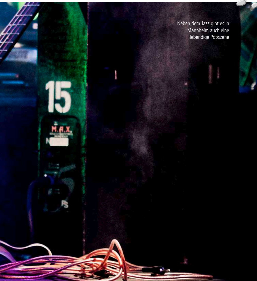
Neben dem Jazz gibt es in Mannheim auch eine lebendige Popszene